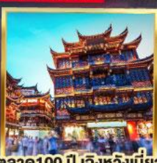
ตลาด 100 ปี เติ้งหวิงเมี่ยว